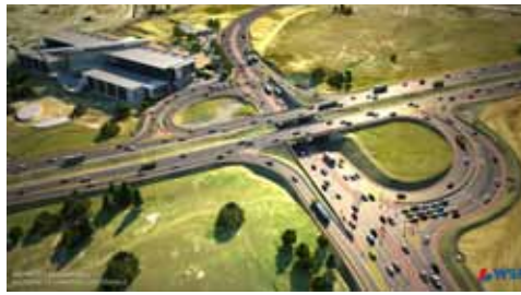
通過逼真的專案視覺效果說明贏得相關利益方的支持。