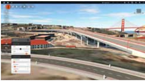
清晰傳達設計意圖，幫助獲得批准。