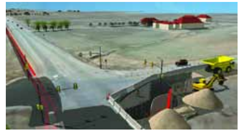
在專案方案的上下文中建立設計概念。